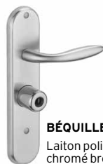
BÉQUILLE Laiton poli ou chromé brossé